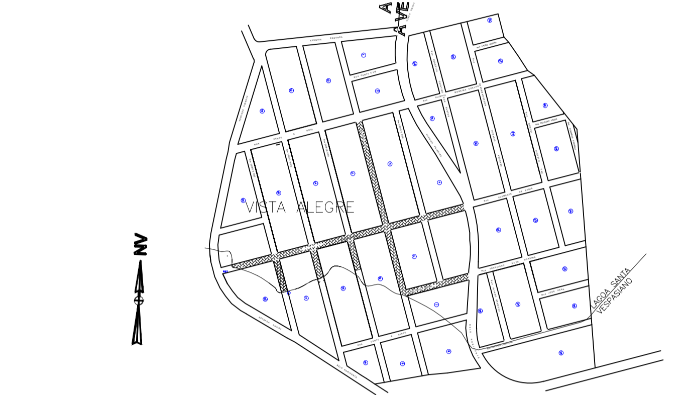
4 PLANTA DE SITUAÇÃO